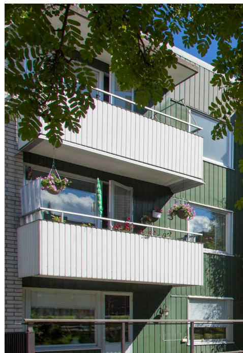
Nya regler för att inglasa balkong

Detaljerna i detta utarbetas under vintern och presenteras senast mars månad 2021.